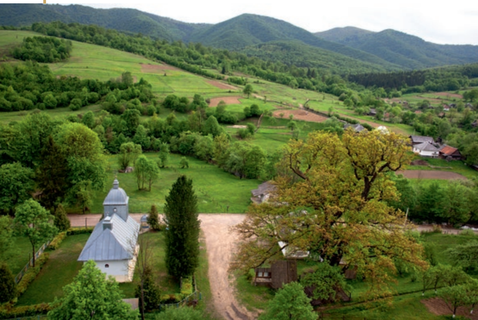
Užanský národný park – pohľad na obec Stužica (G.L.)

Nadsjanský regionálny krajinný park vznikol v roku 1997 na výmere 19 430 ha. Územie sa rozprestiera na dvoch priľahlých horských hrebeňoch, cez ktoré prechádza hranica európskych úmorí. Nachádzajú sa tu pramene Sanu, ktorý patrí do úmoria Baltského mora, a Dnestra, ktorý sa vlieva do Čierneho mora. Lesy a trvalo trávnaté porasty predstavujú okolo 51,6% územia národného parku a poľnohospodárska pôda až 42,9%. Prevažná časť tohto chráneného územia sa má stať súčasťou Národného parku Bojkovščina, ktorý vznikol v roku 2019.