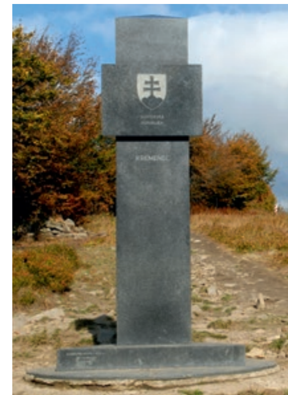
Monolit na hranici Poľska, Slovenska a Ukrajiny – Kremenec (1 210 m n.m.) (G.H.)

Chránená krajinná oblasť Dolina Sanu s rozlohou 28 720 ha vznikla v roku 1992. Veľkú plochu